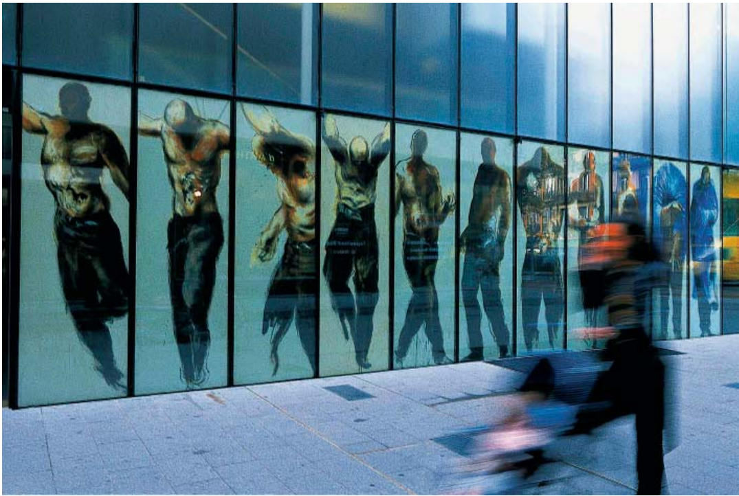
Toulouse, Théâtre national, saison 2001-2002.