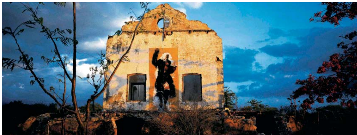
EN HAUT, le Prédicateur , plage de Ramena, sur l'île de Madagascar, ancien camp de la Légion étrangère et ancien crématoire, 2001.

Publications et catalogues: 1988 Berlin ; 1989 Brest ; 1990 Tulle ; 1992 Bilbao ; 1993 La Réussite de Boris , éditions Dialogues; 1997/2000 Visuels pour Noir Désir et Serge Teyssot-Gay d'après G. Hyvernaud ; 2002 Brest de Mac Orlan , éditions Dialogues; 2003 Mada , éditions Alternatives; 2008 Ma vie s'appelle peut-être , Bloas Pouy, Valenciennes 2007; 2008 Penmarc'h ; 2010 Guidel .