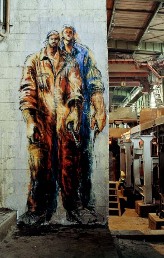
À GAUCHE, Bilbao, 1992, les Nuques de plomb , œuvre collée à l'intérieur d'une usine sidérurgique encore en activité.