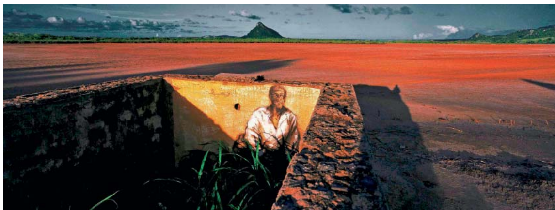
AU MILIEU ET EN BAS, les Yeux de l'enfer , et le Salaire de la peur , Diego Suarez, Madagascar, 2001.